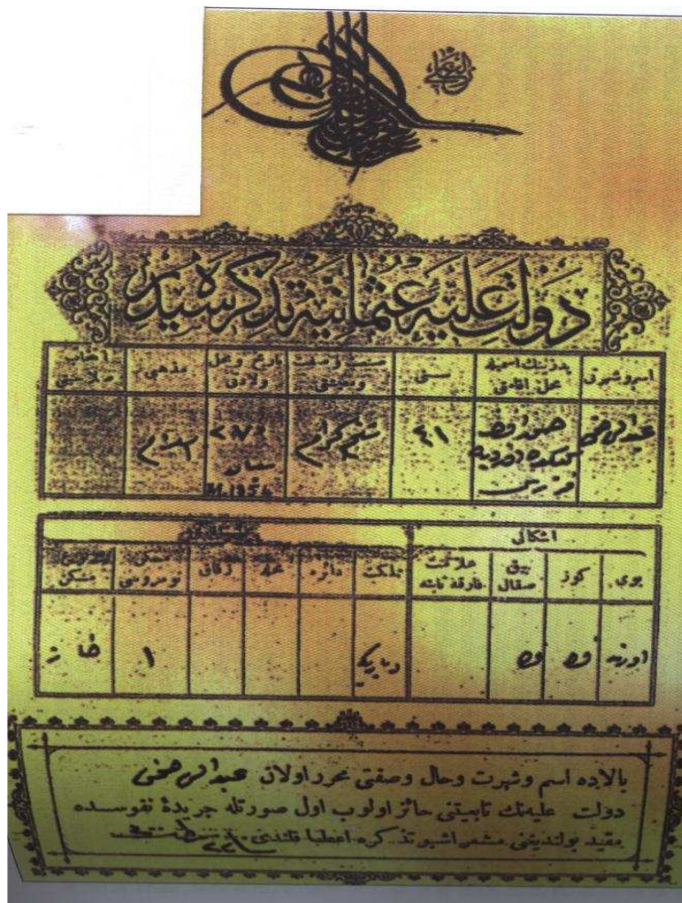
ناسنامہ یا نوسمانی یا ناقتہ پی ژکتیبیا سہیدا زہینہ لعابدین نامہ دی