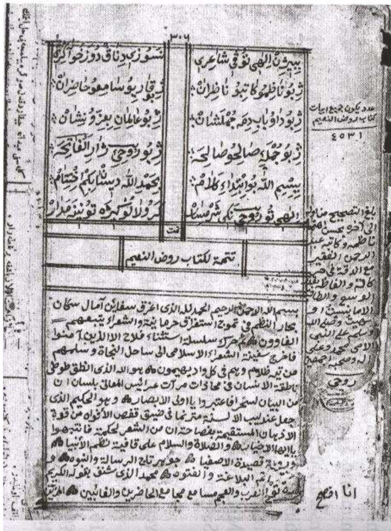
به ربه رى دويماهيبيي ژ (روض النعيم) ب خه تي ناقته پي ژ کتبيبا ته زکړه ي مه شايخي نامه د